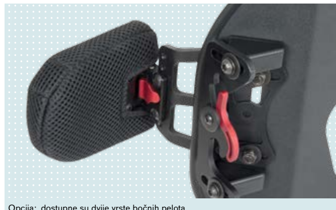
Opcija: dostupne su dvije vrste bočnih pelota