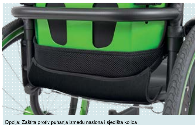
Opcija: Zaštita protiv puhanja između naslona i sjedišta kolica