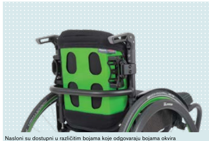
Naslone su dostupni u različitim bojama koje odgovaraju bojama okvira